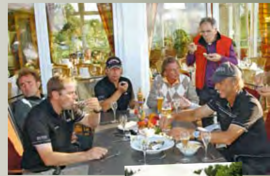
Entspannung nach dem Spiel: Champagner mit feinsten Austern