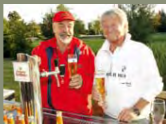
Die beiden Hofbräu-Zapfer