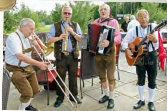
...und die Musik spielte dazu