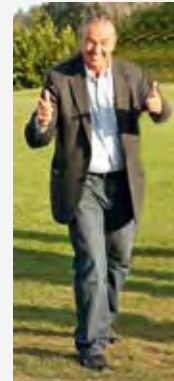
Fotograf Wolfgang List war schwer beschäftigt