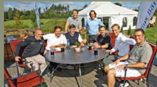
Entspannung vor dem Spiel