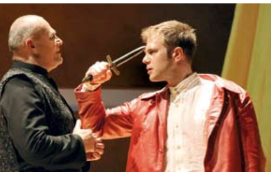
Bildunterschrift Bildunterschrift Bildunterschrift Bildunterschrift