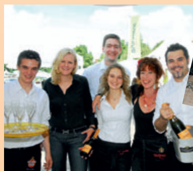
Das Brunnerz Team