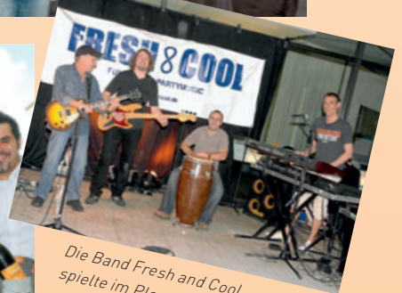
Die Band Fresh and Cool spielte im Plenum