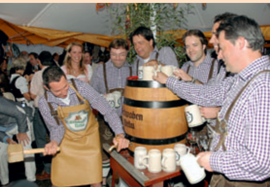
Die Equipe beim Fassanstich